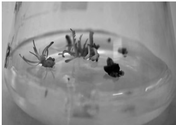
图 2 黑色玛咖叶片诱导分化出丛生芽

为进一步检测上述培养基诱导丛生芽的能力, 块根为黑色的玛咖叶片培养于含有 6-BA 2mg/L+NAA 0.25mg/L 的 MS 培养基, 结果显示在此培养基中, 块根为黑色的玛咖叶片也可被直接诱导产生丛生芽 (图 2)。